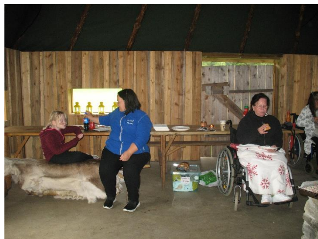
Deltakerne på aktivetsdagen koste seg med grillmat inne i lavvoen