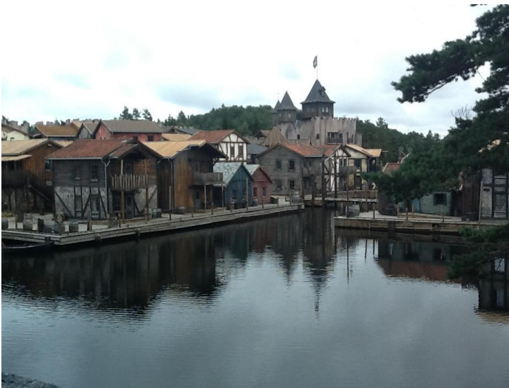
En liten del av Abra Havn august 2013

Vi hadde leiligheter i sjørøverlandsbyen Abra Havn, som åpnet i 2012. Hele landsbyen med resepsjonen, sjørøverkroa «Den Sorte Mann» og alle leilighetene var bygget i sjørøverstil, og alt er 100 % gjennomført.