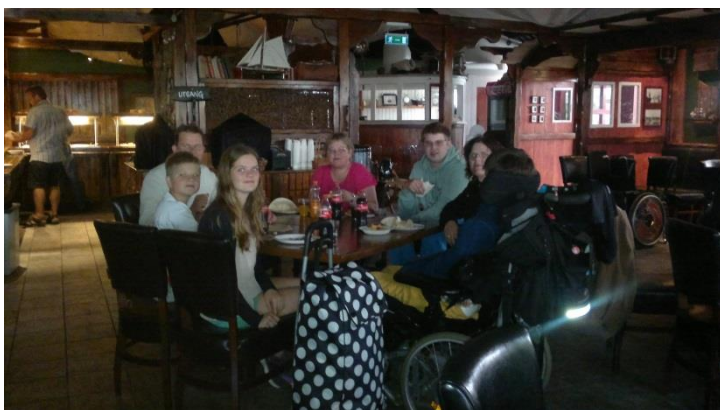
Ved lørdagens Taco-buffet

På lørdag kveld ble det servert Taco-buffet på en restaurant inne i dyreparken.