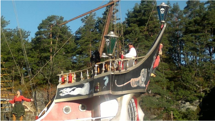
«Den Sorte Dame», med Kaptein Sabeltann