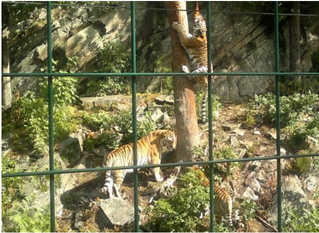
3 av de sibirske tigrene

Vi fikk se både sibirske tigre og løver som måtte virkelig jobbe for å få i seg maten, for den ble hengt høyt oppe.